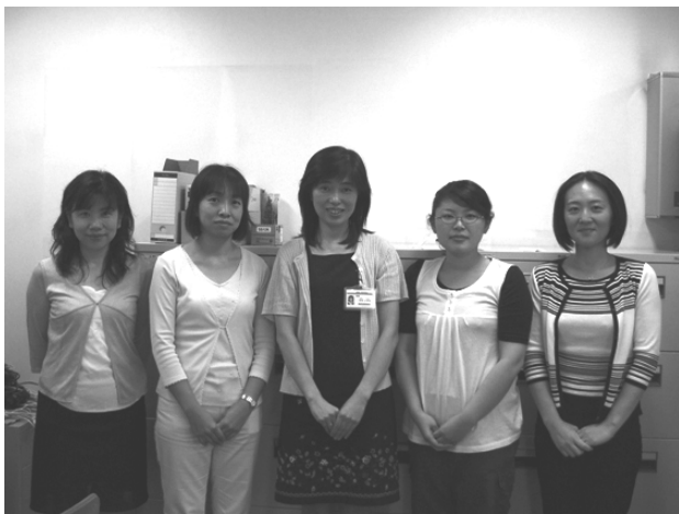
図2. 栃木県地域がん登録のスタッフ

診療連携協議会のがん登録部会などと連携をとって事業を進めやすいこと、県立がんセンター内の院内がん登録の仕組みや方法がわかり、地域がん登録の問い合わせに役立つことがあります。一方で、県の担当者の異動があり継続して登録業務に従事することが難しいというデメリットもあります。今後の課題として、後継者を育成するために引き継ぐ体制を整備していかなければなりません。